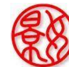
臺北市立景美女子高級中學 TAIPEI JINGMEI GIRLS HIGH SCHOOL