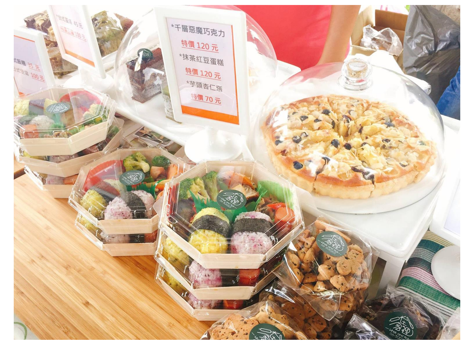
* 分享有機 低碳 在地 環保好物