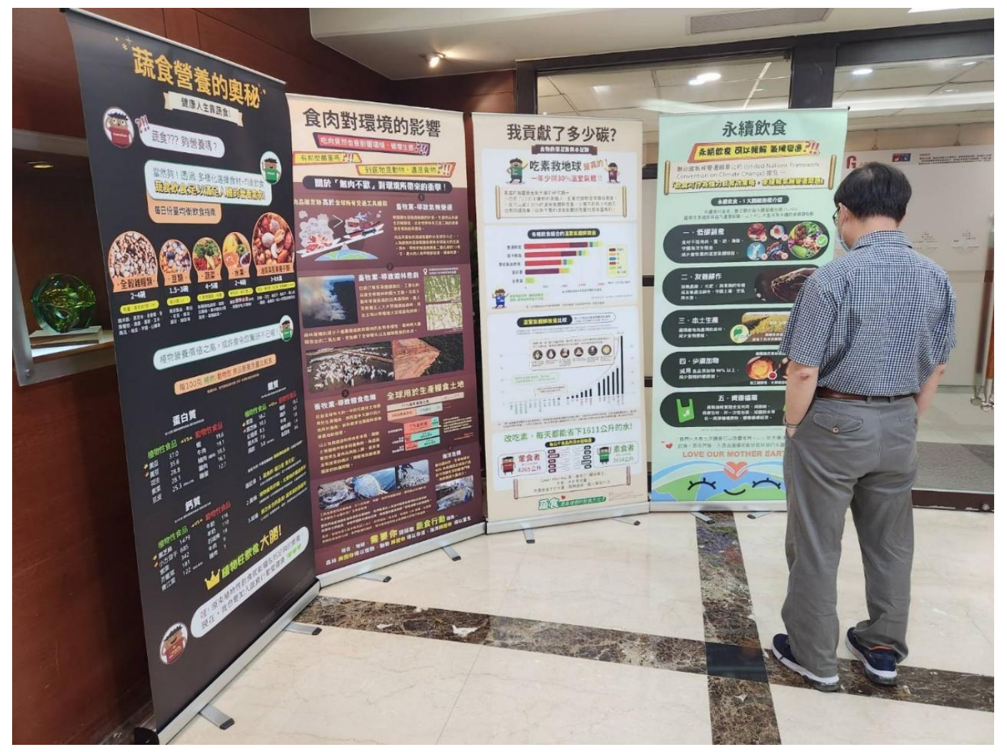
永續知識立牌放在川堂，學生隨時吸收 環境教育新知識